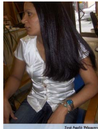
José Aguiló Peluqueros