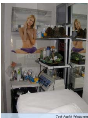
José Aguiló Peluqueros